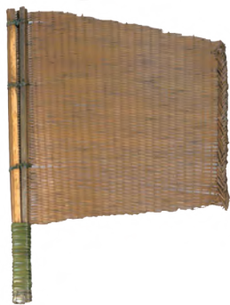
春秋短柄竹扇（复制品） 中国扇博物馆藏