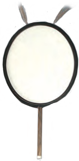
仿魏晋麈尾扇 中国扇博物馆藏

前进的方向。因此，麈尾扇象征着领袖风范。有些名士会以手持麈尾扇为荣，标榜自己是文人中的佼佼者。