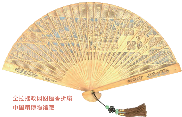
全拉拙政园图檀香折扇 中国扇博物馆藏

折扇虽然精巧，但是制作起来十分不容易，要经过几十道工序才能大功告成，其中主要分为三大步。首先，工匠要精心挑选上等的宣纸或绢帛做扇面，这是折扇的“脸面”；其次，扇骨的备料也马虎不得，要选坚韧的竹子等材料为折扇撑起“脊梁”；最后，再由书画家在扇面上题诗作画，一把精美的折扇才算制作完成。