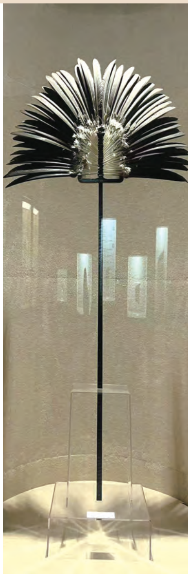
战国长柄羽扇（复制品） 中国扇博物馆藏

它们看上去就像我们使用的菜刀，学名叫“便面”，是中国最古老的短柄扇，除了用于扇风纳凉，还能用来遮挡面部。有趣的是，战国墓出土的那把扇面上还有两个小洞。据专家推测，小洞是古人用来窥视他人的。那时候礼仪烦琐，有时不能直视他人，古人就可以通过扇面上的小洞来观察他人。