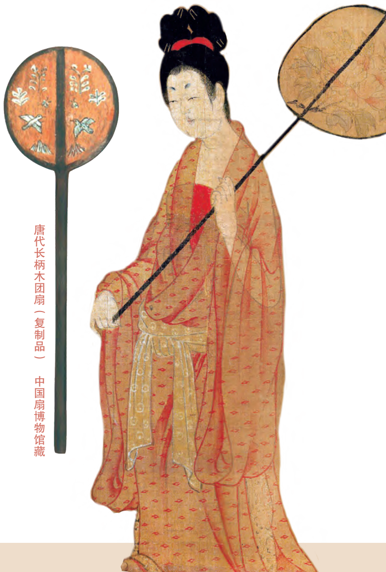
唐代长柄木团扇（复制品） 中国扇博物馆藏

你知道吗？ 团扇不仅在唐代女子间流行，还漂洋过海到了日本呢。直到今天，日本相扑比赛的裁判在裁决比赛时，依旧会手持团扇。有趣的是，在日本，工匠们还曾用铁来制作团扇，这种扇子叫军配团扇，是武将用来指挥作战的，不仅结实牢固，还配有一些装饰图案。