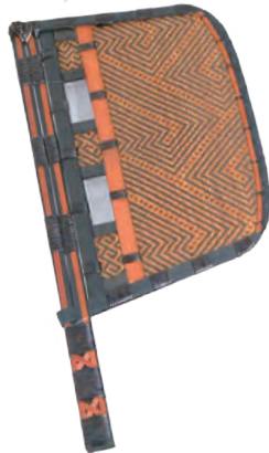
战国短柄竹扇（复制品） 中国扇博物馆藏