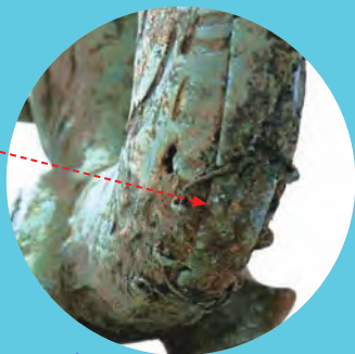
虎头龙身后的青铜片

现在，三星堆遗址出土了数量庞大的龙形或带有龙图案的文物，它们造型各异，各具特色，反映了古蜀人独特的造型艺术和审美观念。专家们研究认为，这些龙形象既展现了古蜀人自身的创造力，也反映了古蜀文明和中原文明的紧密联系和相互影响。三星堆的龙是中国源远流长、博大精深的龙文化的体现，也有力地证明了古蜀文明是中华文明的重要组成部分。