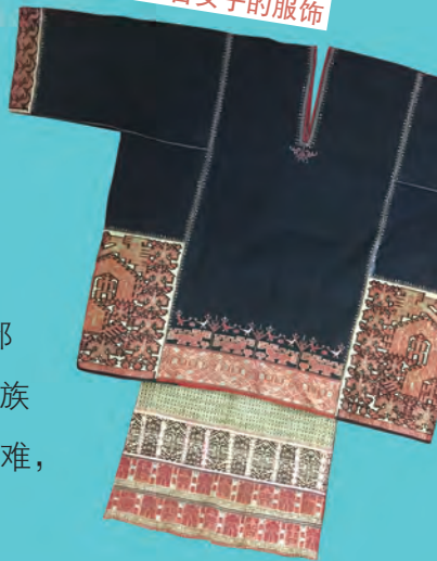
黎族润方言女子的服饰

为了织出彩色的黎锦，织女们还需要借助植物染料，获得各种颜色的线。比如用姜黄的根茎煮汁可得到黄色的染料，用苏木或三角枫树的木材煮汁可得到红色、褐色的染料，用公孙锥或乌墨树的树皮煮汁可得到橘红色的染料，将谷木的叶子捣烂