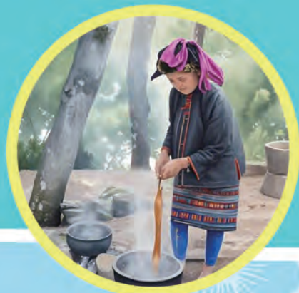
黎族织女正在染色