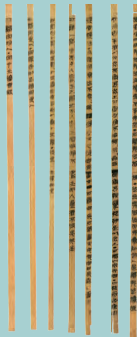
《法律答问》（部分） 湖北省博物馆藏