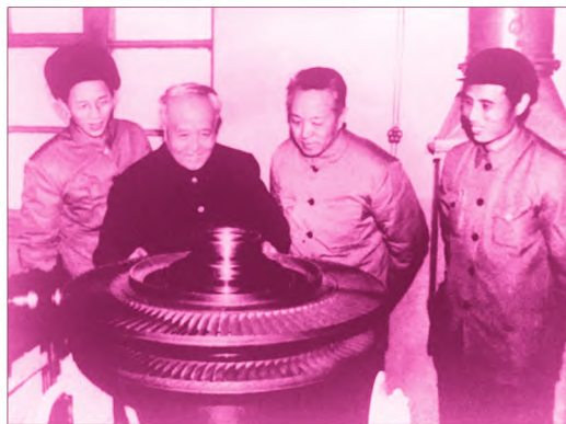
1968年，师昌绪(左二)到工厂检查发动机涡轮盘(图/人民网)

从最初的副研究员到院士，师昌绪在金属所工作了整整30年。这30年里，他成功研制出我国第一代多孔气冷铸造镍基高温合金涡轮叶片，首先开启真空冶炼和真空浇筑涡轮叶片研究，研发出航空发动机所用关键材料……师昌绪不愧为“中国高温合金之父”。