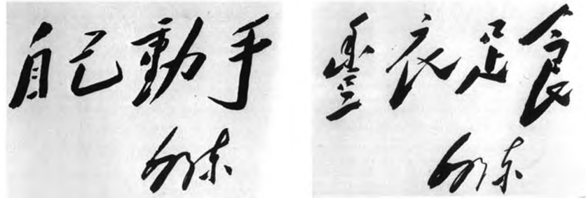
◆毛泽东亲笔题写“自己动手，丰衣足食”。