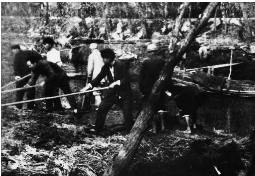
◆1943年，毛泽东在大生产运动中开荒种地。

“军政一致军民一致”的优良作风，是党攻坚克难的重要条件。“没有一个人民的军队，便没有人民的一切。”大生产运动是军民团结一致共同创造的奇迹。毛泽东指出，军队的大生产运动，不但改善了生活，减轻了人民负担，而且也改善了军民关系，比如在生产中，军民变工互助，更增强了他们之间的友好关系。人民群众称赞第359旅官兵：“过去反动军队是吃粮的，尔格（即你们）军队还生产缴公粮；军队不打扰老百姓，还减轻了人民的负担，真是天下大变样，人民坐天下了。”这一时期开展的拥军优属和拥政爱民运动（即“双拥”），也进一步增强了党政军民的团结，奠定了共克时艰的基础。2023年正逢毛泽东等老一辈无产阶级革命家倡导的延安双拥运动80周年，大力弘扬拥军优属、拥政爱民光荣传统，巩固发展军政军民团结，具有重要的历史意义和时代价值。强国必须强军，军强才能国安。在新时代新征程上，我们必须坚持党对人民军队的绝对领导，坚持走中国特色强军之路，同时发展良好的军政关系，珍惜军民的鱼水深情，以强军梦支撑强国梦，克服前进道路上的一切艰难险阻，为实现中华民族伟大复兴共同奋斗。■