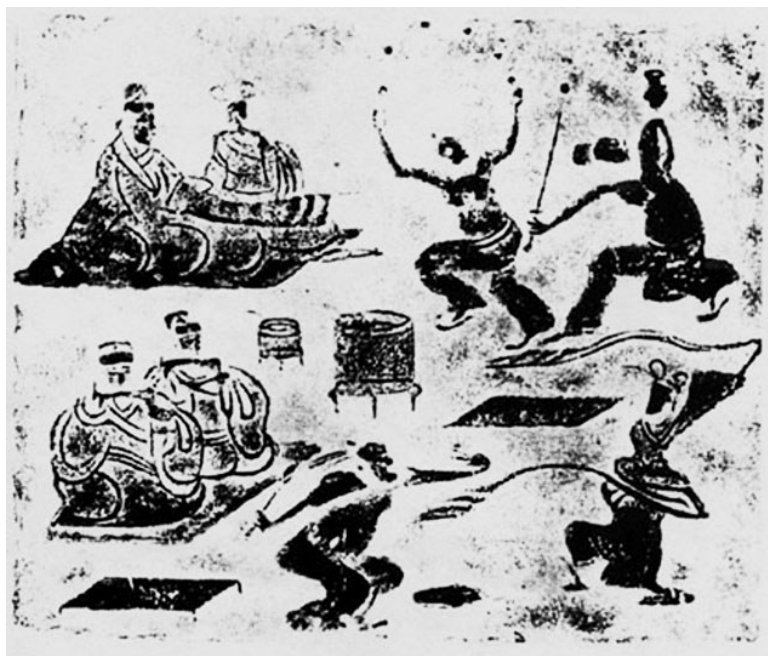
汉代画像砖《宴饮图》