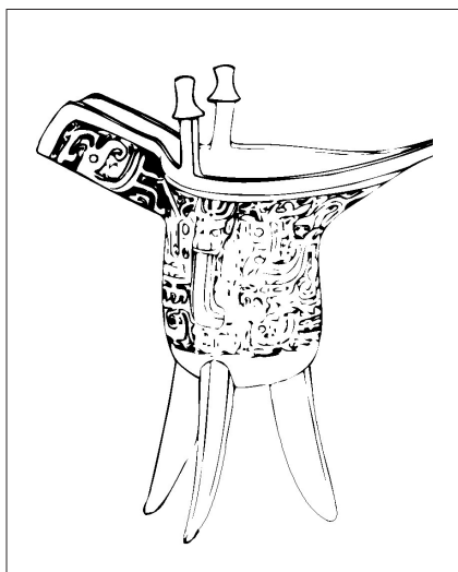
商周时代的酒杯——爵