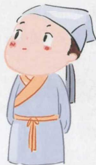
在外求学的读书人

古人过年也会踏上春节返乡之旅。你知道吗?古代也有春运,但由于交通比较落后,人口流动的数量并不大,距离也大多不太远,因此,古代春运的主体也并非“外出务工人员”,而大多为读书人、公务人士和商人。