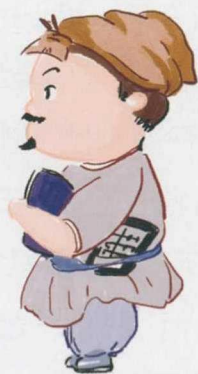
在城市打工的手工艺人和商人