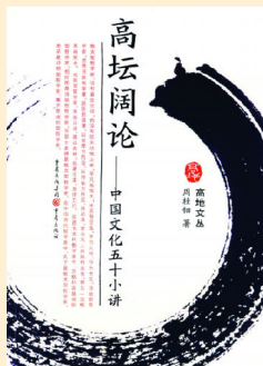
《高坛阔论——中国文化五十小讲》 周桂钊著 重庆出版社 2008.7 定价：22.00元

正月初一，早晨很早起床，一开门，先在门前放一鞭炮，表示已经起来。这一天的禁忌有：不干活，不拿铁器，不扫地，不倒垃圾，不倒水。水是银，代表钱财，倒水意味着破财，所以要忌。吃饭要小心，不能打破碗盘杯碟，打破碗，是今年要死人的兆头，特别忌讳。早饭吃素。小朋友都穿上最新最好的衣服，吃饱就玩。不吵架，不打仗，好像这一天不和谐，会给这一年带来不好的命运。每个人都觉得应该过好这一天。拿着压岁