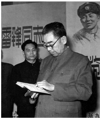
1963年3月，周恩来阅览雷锋日记。

沈阳军区《前进报》编辑董祖修是阅读、摘录雷锋日记较早的人之一。董祖修第一次接触到雷锋日记是在1960年10月。一天，《前进报》总编辑嵇炳前向董祖修介绍了报社拟宣传雷锋的计划，并把5本日记交给他，