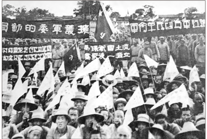
红军改编誓师大会。红军指战员决心“为保卫国土流尽最后一滴血”

万众一心的凝聚力是无形的力量，在以后一直成为鼓舞中国人民为实现民族复兴而团结奋进的重要精神动力。